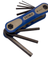
Llaves hexagonales en estuche, 8 piezas, 1,5-8 mm 46-8-F