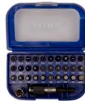
Juego de puntas de 1/4" con adaptador, vaso y portapuntas 475-32-1